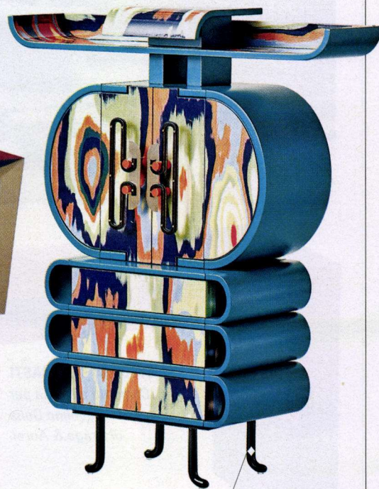
COME UN KIMONO Cabinet Meisen di Alpi in legno con decoro ispirato alla tessitura Ikat.