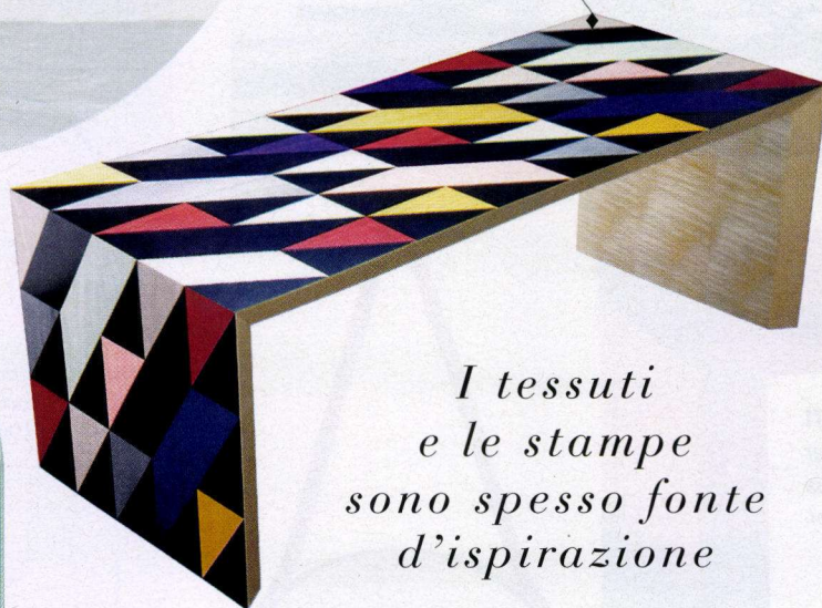
PATTERN SU LEGNO Panca Marquetry Magnificence di Patternity a intarsio.