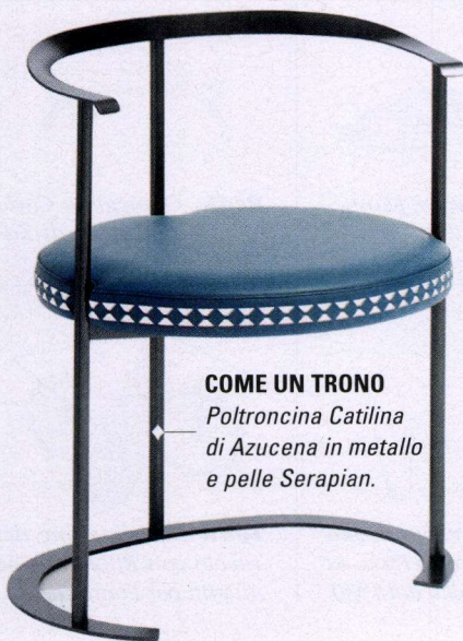
COME UN TRONO Poltroncina Catilina di Azucena in metallo e pelle Serapien.