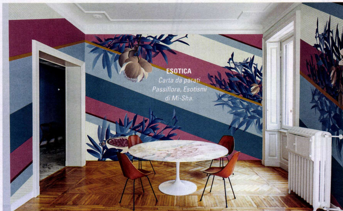
ESOTICA Carta da parati Passiflora, Esotismi di Mi-Sha.