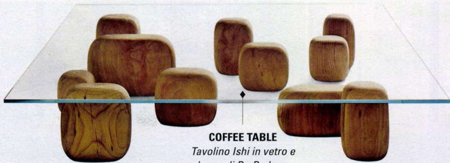
COFFEE TABLE Tavolino Ishi in vetro e legno di De Padova.