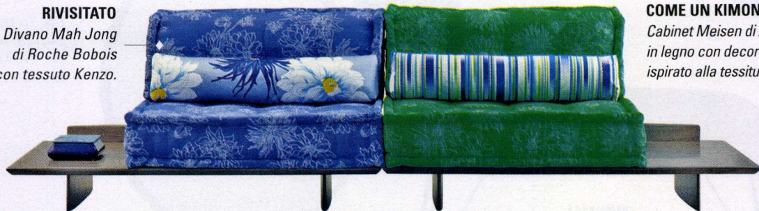
RIVISITATO Divano Mah Jong di Roche Bobois con tessuto Kenzo.

I tessuti e le stampe sono spesso fonte d'ispirazione