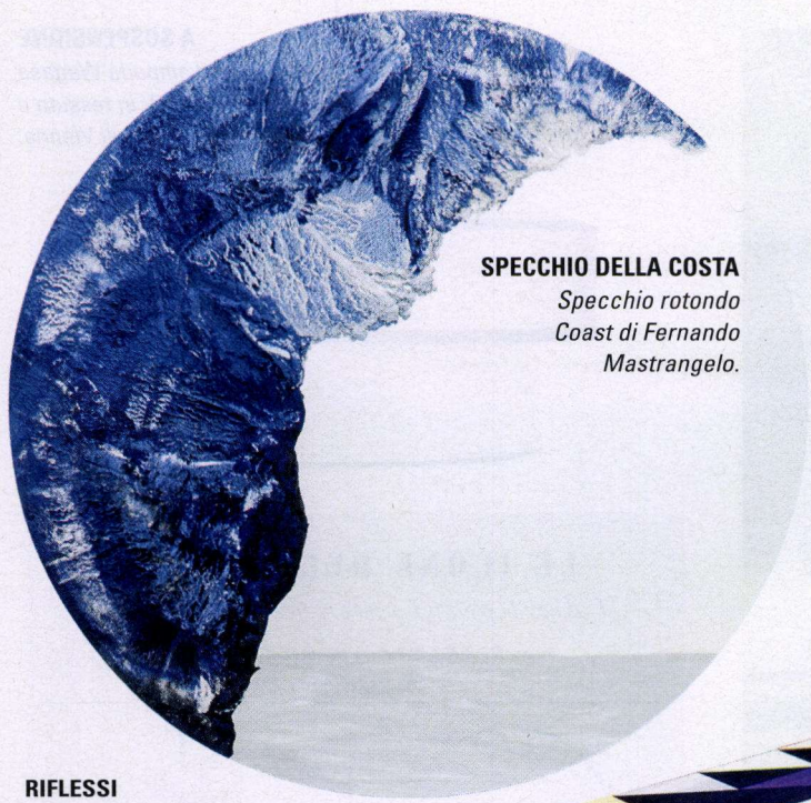
SPECCHIO DELLA COSTA Specchio rotondo Coast di Fernando Mastrangelo.